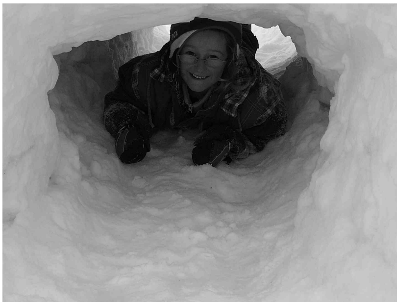
brána do ledového království