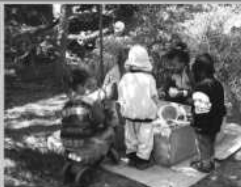
Pískoviště pro děti

Zveme Vás na tradiční sborové setkání u manželů Slabých.