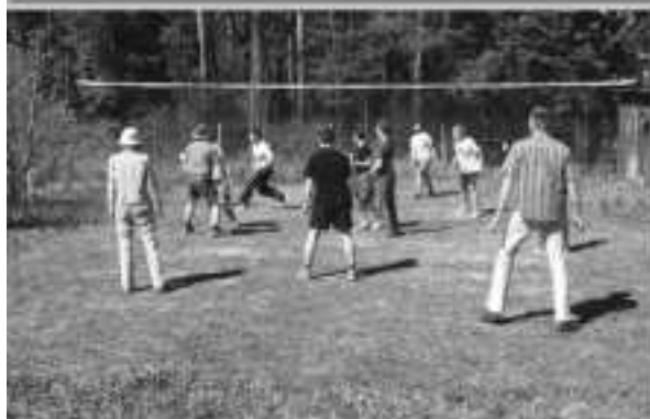
Sport volejbal, pingpong ...