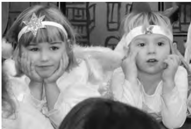
A ještě jedno foto z vánoční hry