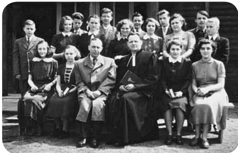
Konfirmace 25. 4. 1954 poznali jste je? Poznali jste se?

Mimo práci pro sbor pracoval i na synodní radě v odboru mládeže, byl autorem podrobných osnov pro péči o mládež, byl jednatelem Jeronýmovy jednoty, pracoval v hymnologickém odboru při přípravě nového vydání evangelického zpěvníku, připravoval vánoční pásma pro děti a mládež pro všechny sbory.