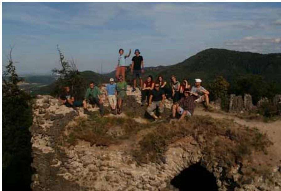
Dobyli jsme Šumberk!