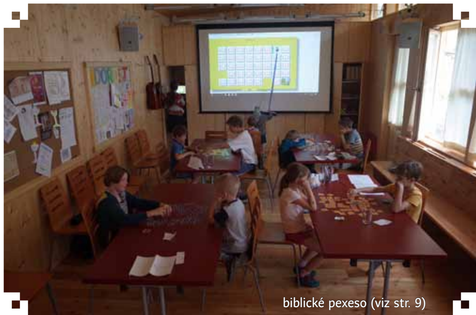
biblické pexeso (viz str. 9)