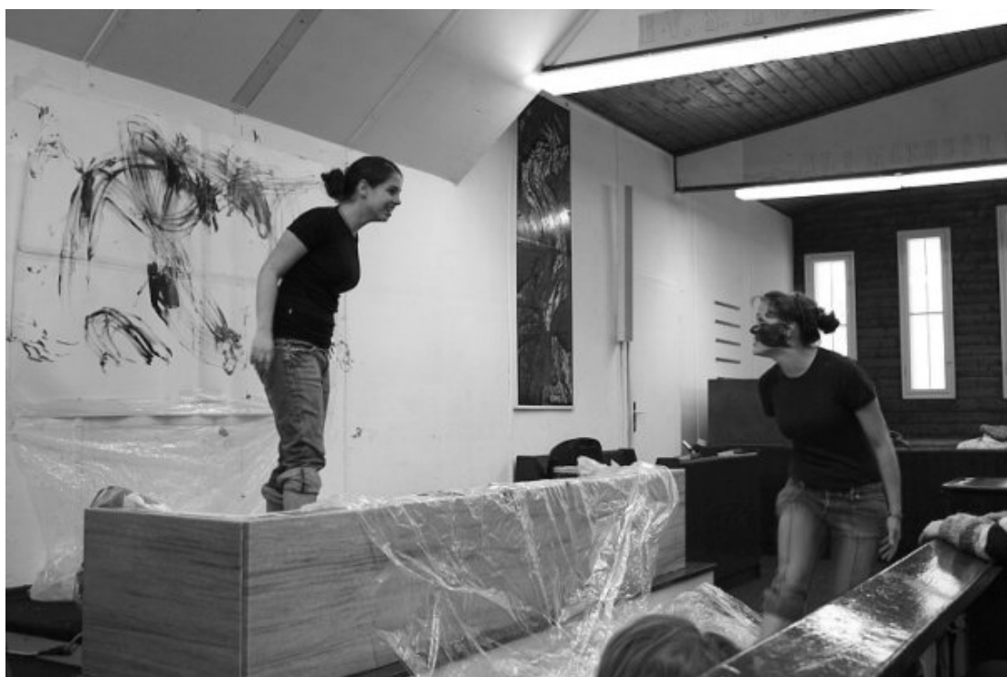
Vzpomínka na BraníXobě I.

Pište, skládejte, komponujte a přijďte svůj výtvar předvést v tomto pásmu autorských počinů členů a přátel branického sboru. Začneme hned po bohoslužbách tj. cca v 10:30. Pozor! Váš příspěvek nesmí trvat déle než 10 minut.