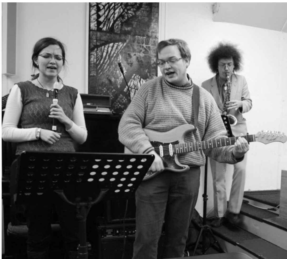
Vzpomínka na BraníXobě I.