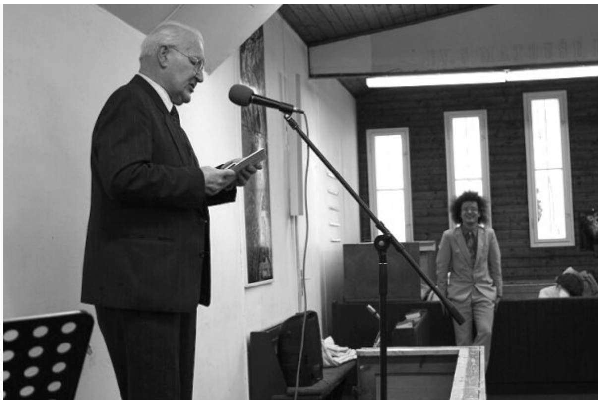
Vzpomínka na BraníXobě I.