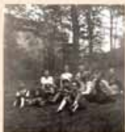
Nedělní škola u Hájkova pomníku na Závisti

1 .1. vikář Harych uznání brig. hodin členům KSČ 10 dětí odjelo do kolonie bazar s kult. programem