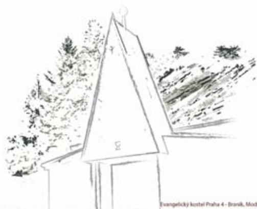
Evanglický kostel Praha 4 - Braník, Modřanská 1821/118