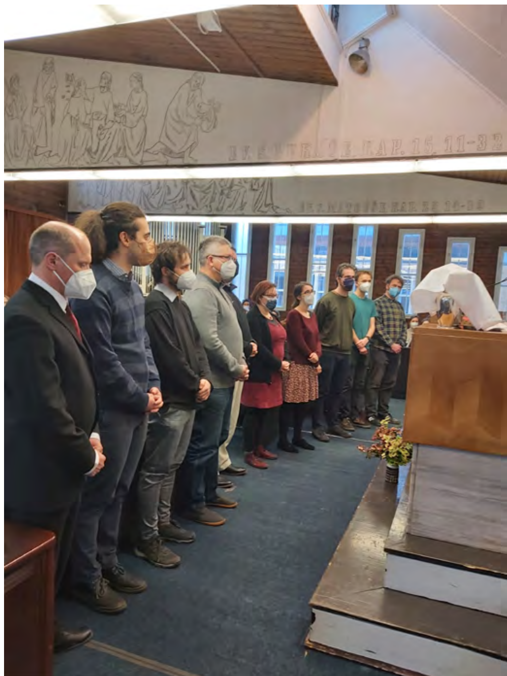
z pověření nového staršovastva