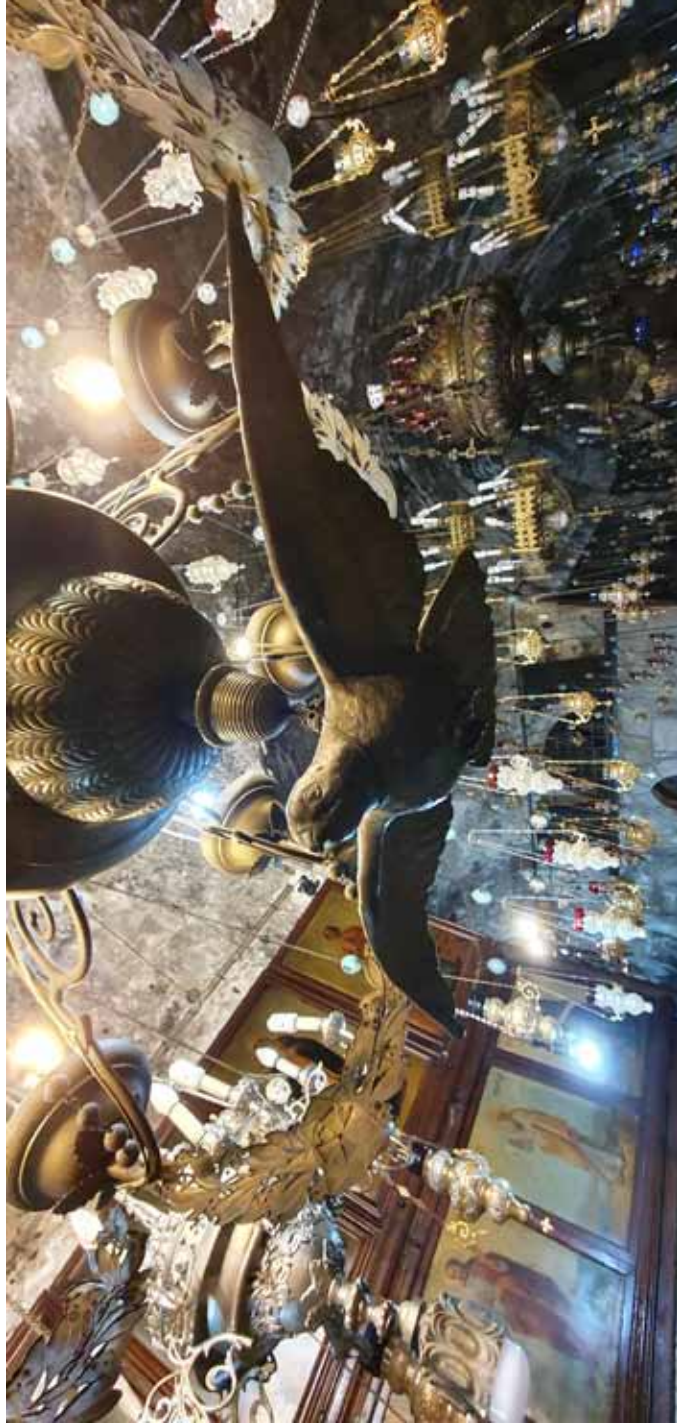
detail lustru v pravoslavném místě hrobu Marie Panny (k článku Návštěva Jeruzaléma na str. 19/20)