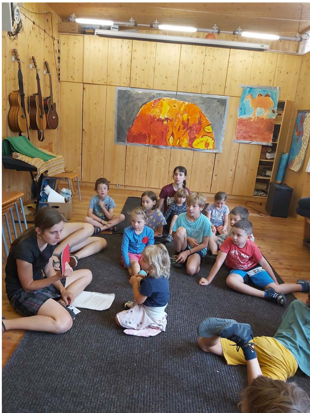
příměstský tábor Boj o Králičí ostrov (článek na straně 9)