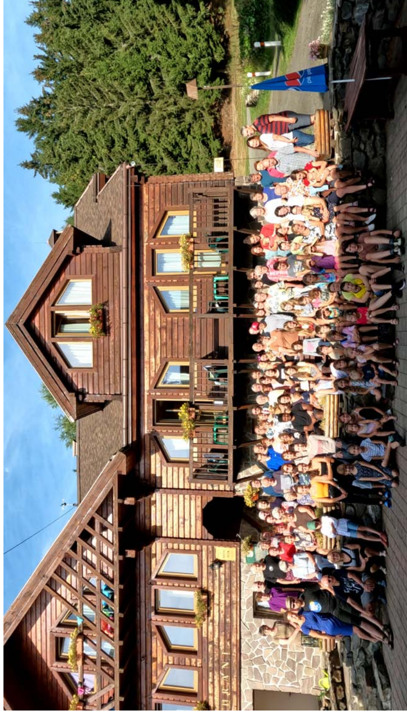
23. sborová dovolená 13.-20. srpna 2022 Nové Město v Krušných horách