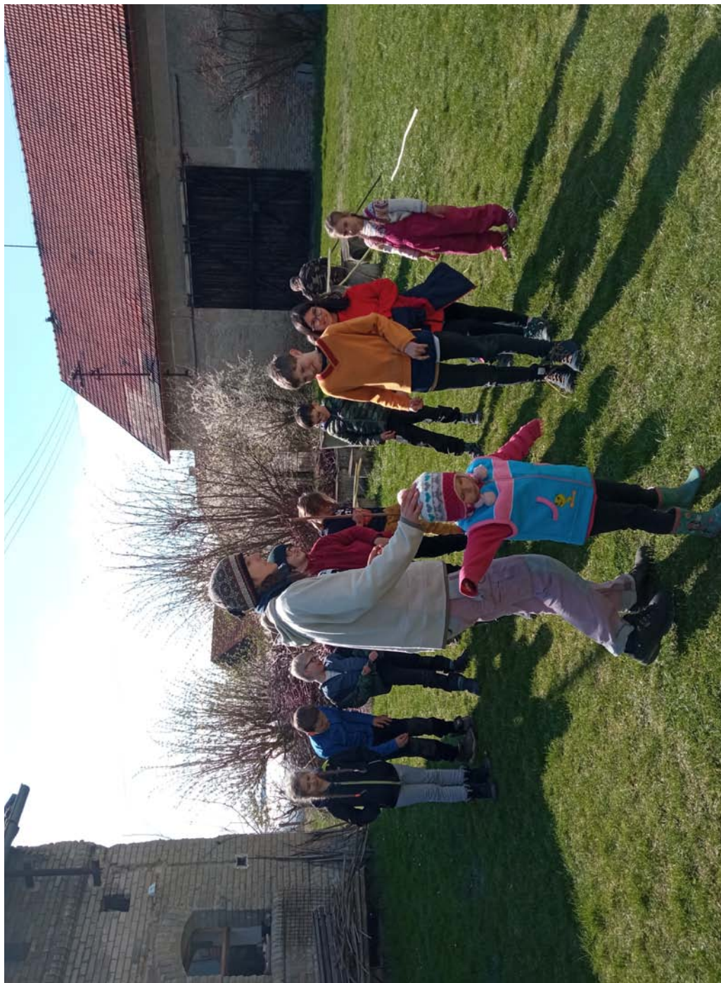
Lucky Luke, dorostová výprava (str. 4)