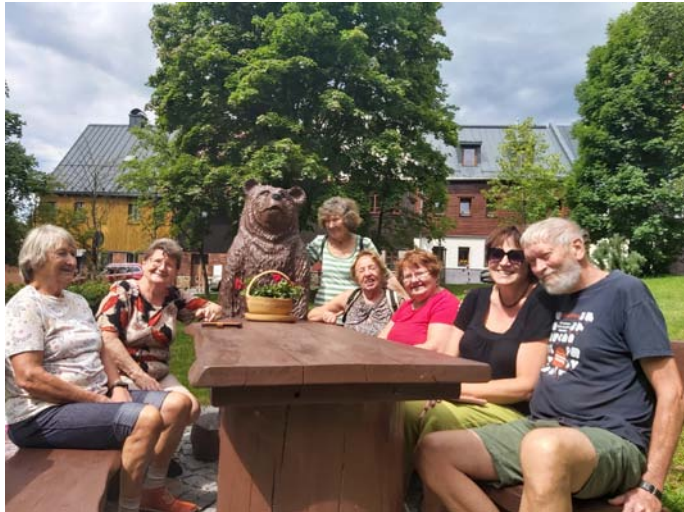
U stolu společně s medvědem