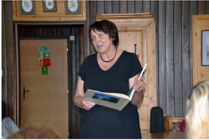
Představení almanachu sborových dovolených