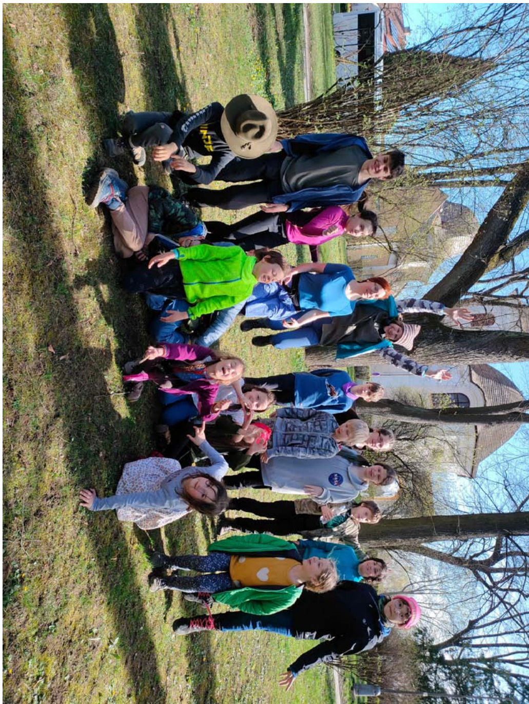
velikonoční výprava mladšího a staršího dorostu