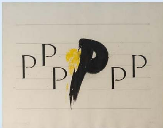
PROVOKACE, kaligrafie na ručním papíře, 1983

Periferie cafe, Branická 473/49, Praha 4