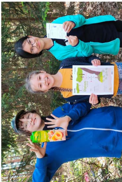
Biblická stezka 2024 – více se dočtete na straně 5.