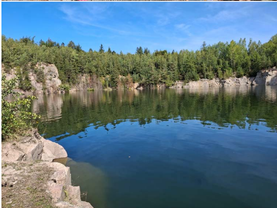
fotila Zuzka Věrka Pavlíková