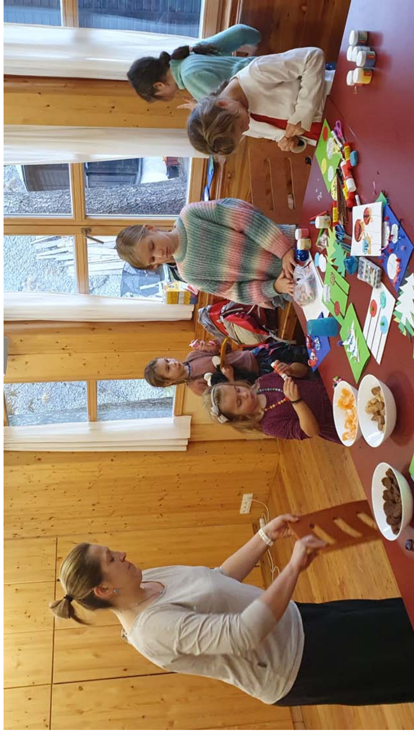
Děti v nedělní škole vyrábějí vánoční přání pro členy sboru.